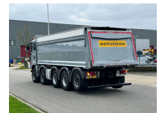
MAN TGS 50.460 10x4 Rechenmaschine 08/15