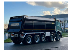
Mercedes-Benz Arocs 5053 10x8 Mercedes-Benz (2018)