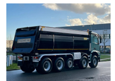
Mercedes-Benz Arocs 5053 10x8 Manufacturación: 2018