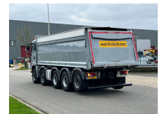
MAN TGS 50.460 10x4 Rechtsmotor, 2018